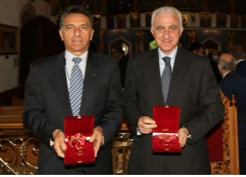
Ο Πρόεδρος & ο Ύπατος Αρμοστής

ΕΟΡΤΟΛΟΓΙΟ ΙΟΥΛΙΟΥ 01. Ανάργυρος, Αργύριος, Δομιανός, Κοσμάς 07. Κυριακή 08. Θεόφιλος, Γρακώπιος 11. Όλγα, Ευφημία 14. Νικόδημος 17. Μαρίνα 18. Αμιλιανός 20. Ηλίας 22. Μαρκελίνα, Μαγδαληνή 24. Χριστίνα 25. Άννα 26. Παρασκευή 27. Παντελεήμων 28. Χρυσοβαλάντης, Χρυσοβαλάντου 29. Καλλίνικος 31. Ιωσήφ Χρόνια Πολλά στους εορτάζοντες!!