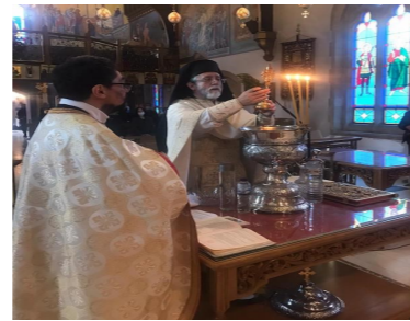
ΘΕΟΦΑΝΕΙΑ ΣΤΗΝ ΕΚΚΛΗΣΙΑ ΜΑΣ