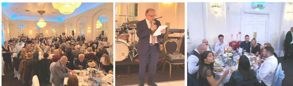
Φωτογραφίες από το Επίσημο Δείπνο της Εκκλησίας μας!!!