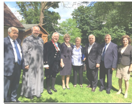
Από την επίσκεψη του High Sheriff of Hertfordshire κ. Στέλιου Στεφάνου με την Οικογένειά του.