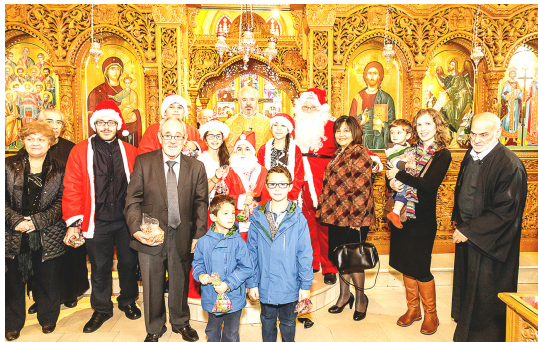
Φωτογραφίες από δραστηριότητες της Εκκλησίας μας.