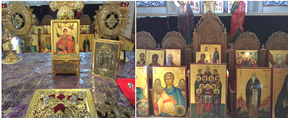
Από την Κυριακή της Ορθοδοξίας στην Ενορία μας!!

Στην περίοδο της Μεγάλης Τεσσαρακοστής που διανύουμε και ιδιαίτερα της Μεγάλης Εβδομάδας που έρχεται, ας μιμηθούμε την κενωτική θυσία του Χριστού, που πρόσφερε τον εαυτό του για τους άλλους, ώστε να ενεργούμε και για εκείνους που υφίστανται κακώσεις, θλίψεις, διωγμούς και αδικίες και όπου μπορούμε να τους προσφέρουμε τη δική μας παρηγοριά.