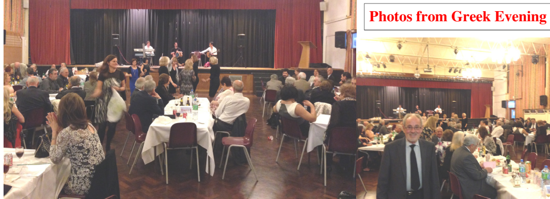
Photos from Greek Evening