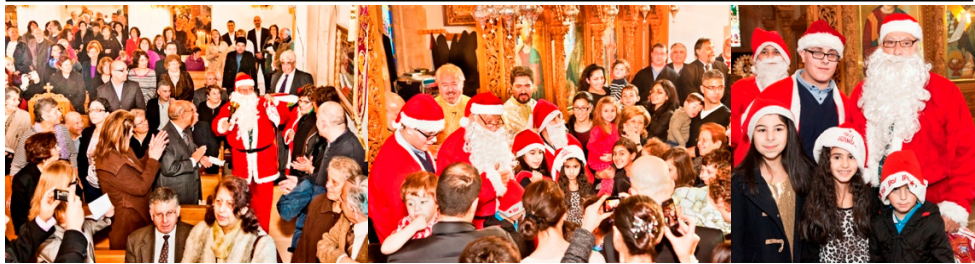
Φωτογραφίες με τον Άγιο Βασίλη και το φαγητό των Ηλικιωμένων